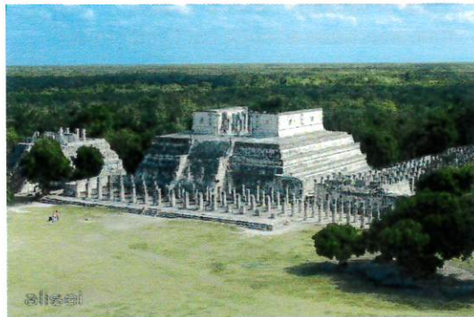
TEMPIO DEI GUERRIERI – CHICHEN-ITZA (MESSICO)