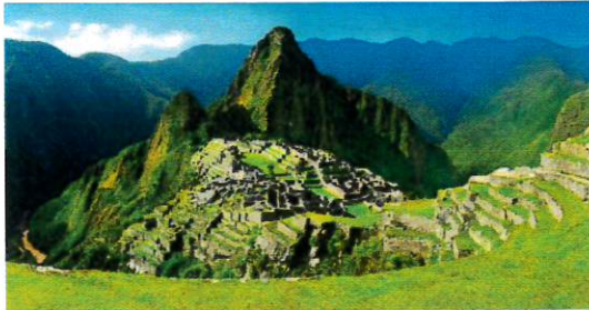
MACHU PICCHU (PERU)